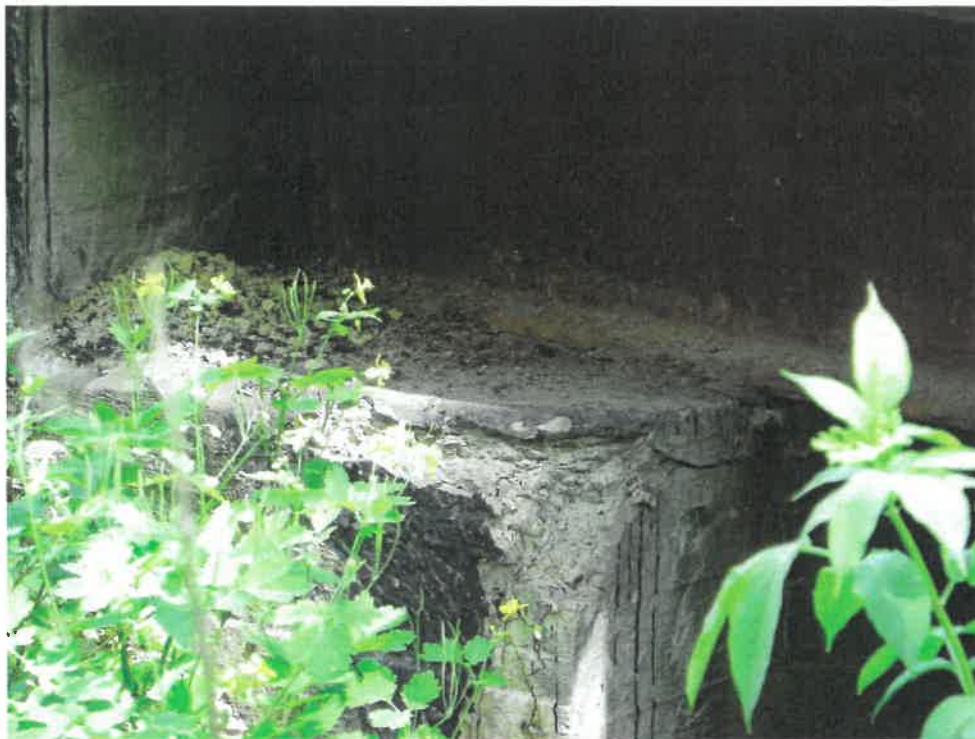
Fot. 1. Korozja, zarysowania i ubytki betonu przyczółków w strefie naroży. Zacieki z białymi wykwitami węgla wapnia oraz wegetacja mchu na powierzchni. Wegetacja roślinności na skarpie.