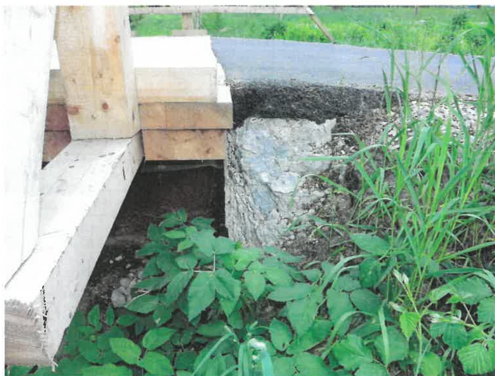
Fot. 4. Korozja betonu ścianek zapleczych.