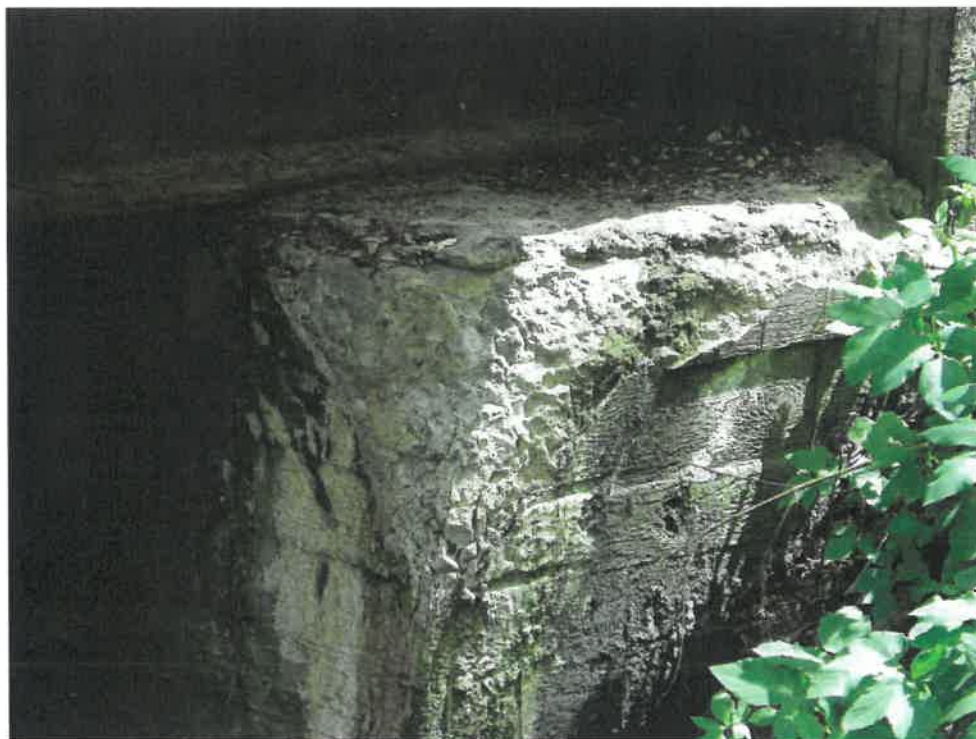
Fot. 3. Korozja, zarysowania i ubytki betonu przyczółków w strefie naroży. Zacieki z białymi wykwitami węglańu wapnia oraz wegetacja mchu na powierzchni. Wegetacja roślinności na skarpie.