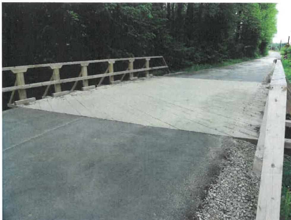
Fot. 1. Widok na obiekt i jezdnię.