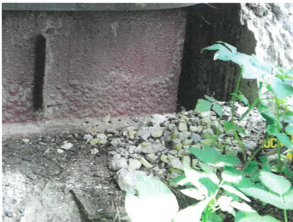
Fot. 2. Korozja, zarysowania i ubytki betonu przyczółków. Zacieki z białymi wykwitami węgla wapnia oraz wegetacja mchu na powierzchni.