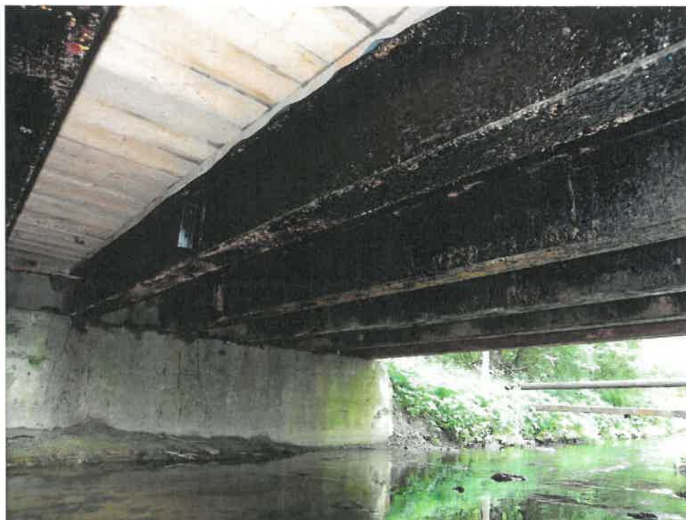
Fot. 3. Widok na ustrój nośny, przestrzeń podmostową i przyczółek.