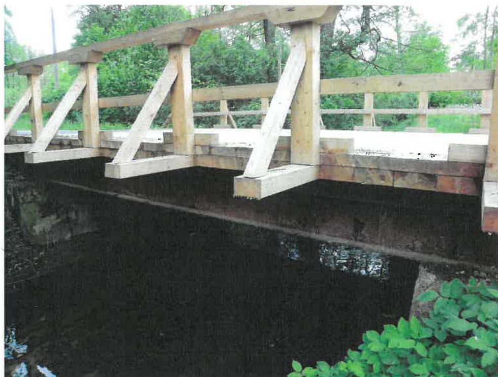
Fot. 2. Widok z boku.