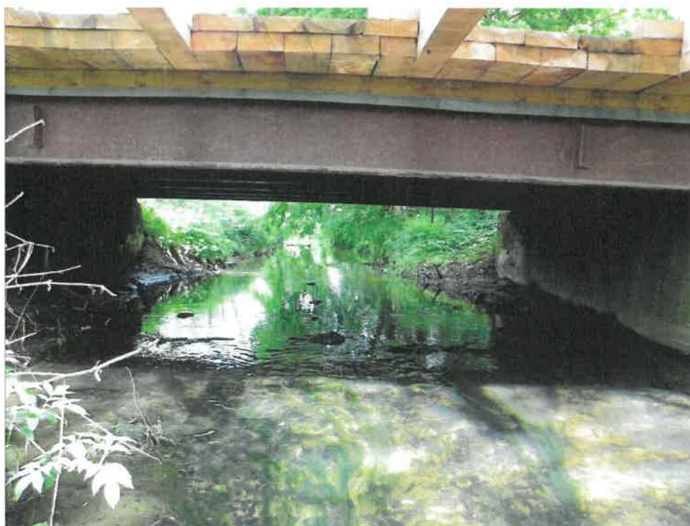
Fot. 4. Widok na przestrzeń podmostową i przyczółek.